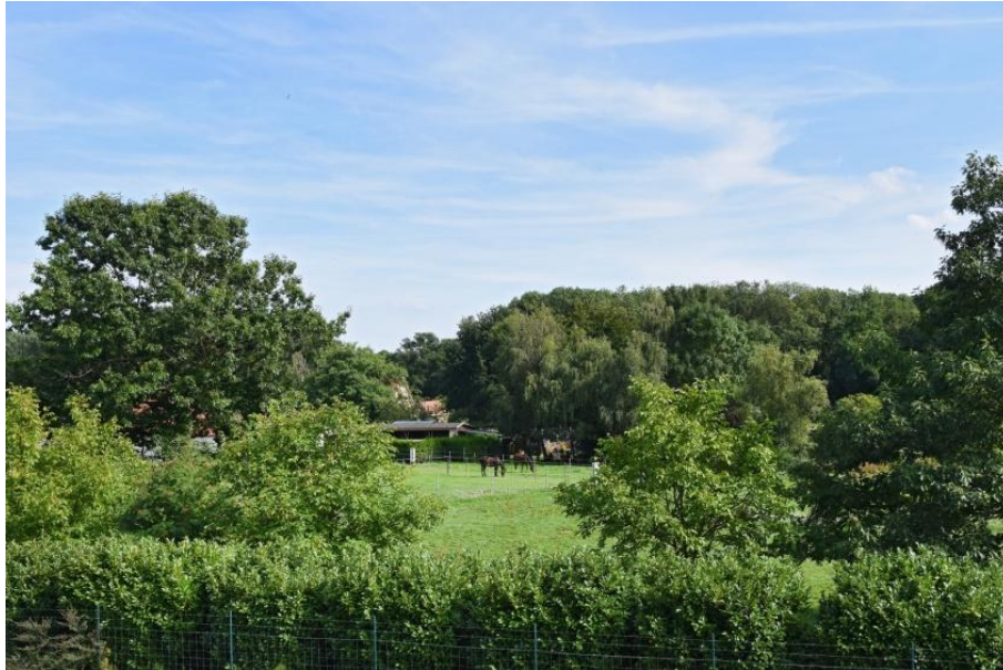
uitzicht voorzijde woning